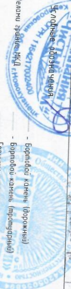
1 Размеры указаны в метрах