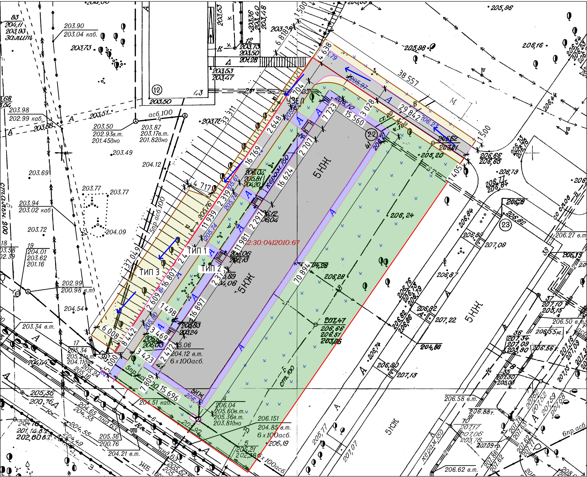
Разбивочный план участка М1:500