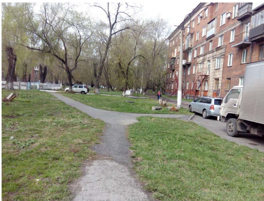
Рис. №2. Состояние проезда.